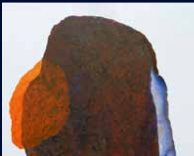
Elke Albrecht, Growing 648, 2021, Acryl auf Leinwand, 80 x 100 cm